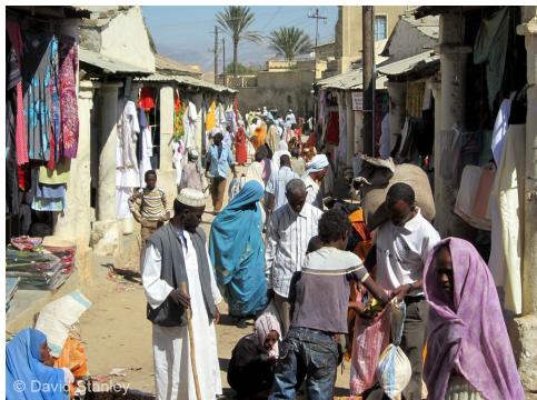
厄立特里亚服装市场

宗教： 厄立特里亚是一个相对年轻的国家，但在宗教自由和人权纪录方面，却是排名最差的国家之一。它只承认逊尼派伊斯兰教、厄立特里亚东正教、罗马天主教和路德会为合法宗教，别的宗教都是非法，因此必须消灭。基督徒若因私自拥有基督教刊物，或甚至只是因祈祷而被捕，都会被无限期拘留而无需审判。厄立特里亚基督徒面对的逼迫，来自教会内和教会外。厄立特里亚历史悠久的东正教会，认为别的宗派都是不合法的，部分原因可能是害怕失去国中首要基督教派的角色。另一方面，政府视基督徒为西方间谍，会威胁到国家统治。政府容不下任何异见分子，因此经常搜查家庭教会，拘捕正在崇拜的基督徒。单是去年，已经有 300 多名基督徒被捕。